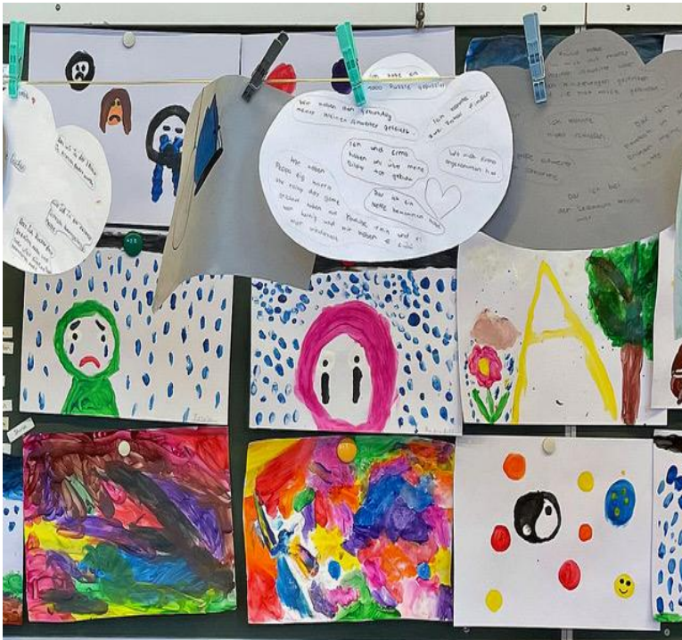
Hospiz macht Schule“

Die Ausstellung ist innerhalb der Bürozeiten Mo-Fr von 9:00-13:00 Uhr geöffnet und bis zum 10. Mai 2024 zu sehen.